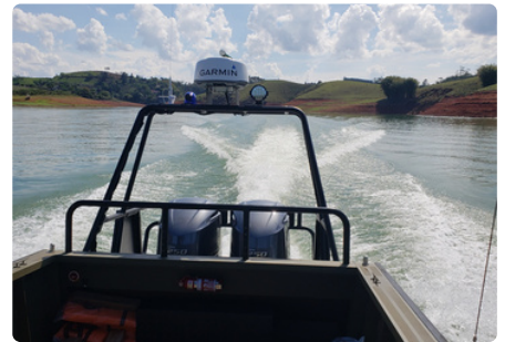
Motores de Popa Outboard Motors