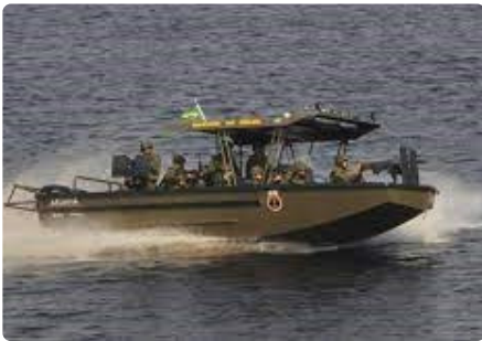
Alta Resistência e Manobrabilidade High resistance and maneuverability