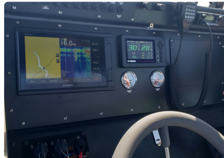
Modernos equipamentos de navegação Modern equipments of navigation